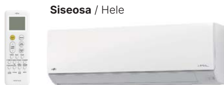
Siseosa / Hele