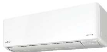
ASYG 09-14 KMCEN