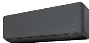
ASYG 09-14 KMCEN/-B